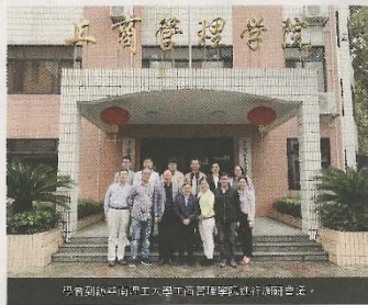
學者到訪中國南理工大學工商管理學院進行研討交流。

港府積極推廣粵港澳大灣區發展，大力發展創新科技和金融產業，更鼓勵人才在大灣區內流通。為全面了解和改善區內企業的獎勵管理措施，三大人力管理權威機構合作進行一項研究項目，名為《粵港澳大灣區薪酬及福利調查》(下稱調查)。 是次調查由華南理工大學人力資源管理研究中心、香港浸會大學人力資源策略及發展研究中心，以及香港人才管理協會攜手合辦，合作三方於本月24日(星期三)在香港浸會大學舉行簽署儀式，為調查正式揭開序幕。